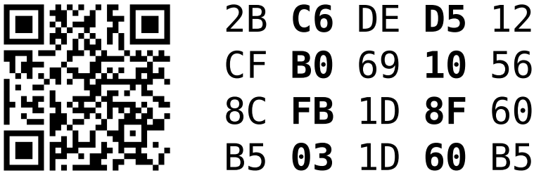
Abbildung 1: QR Code und Fingerabdruck

zugeordnet ist. Bei einigen Apps musst du nur einen Fingerabdruck für alle Geräte verifizieren, bei anderen musst du einen Fingerabdruck für jedes Gerät verifizieren. Einige Apps senden Mitteilungen in der Konversation, wenn sich der Fingerabdruck deines Kontakts ändert, was möglicherweise auf etwas Schändliches hindeutet. Einige Apps tun dies leider nicht. Du musst alle Fingerabdrücke für alle Geräte verifizieren, und wenn sich ein Fingerabdruck ändert, musst du ihn erneut verifizieren , da sonst deine gesamte Sicherheit zunichte gemacht werden könnte. Außerdem geben einige Chat-Apps die von deinen verifizierten Geräte nicht für andere Geräte frei, und aufgrund dieser schlechten Benutzerfreundlichkeit musst du die Geräte aller deiner Kontakte von jedem deiner eigenen Geräte aus verifizieren.